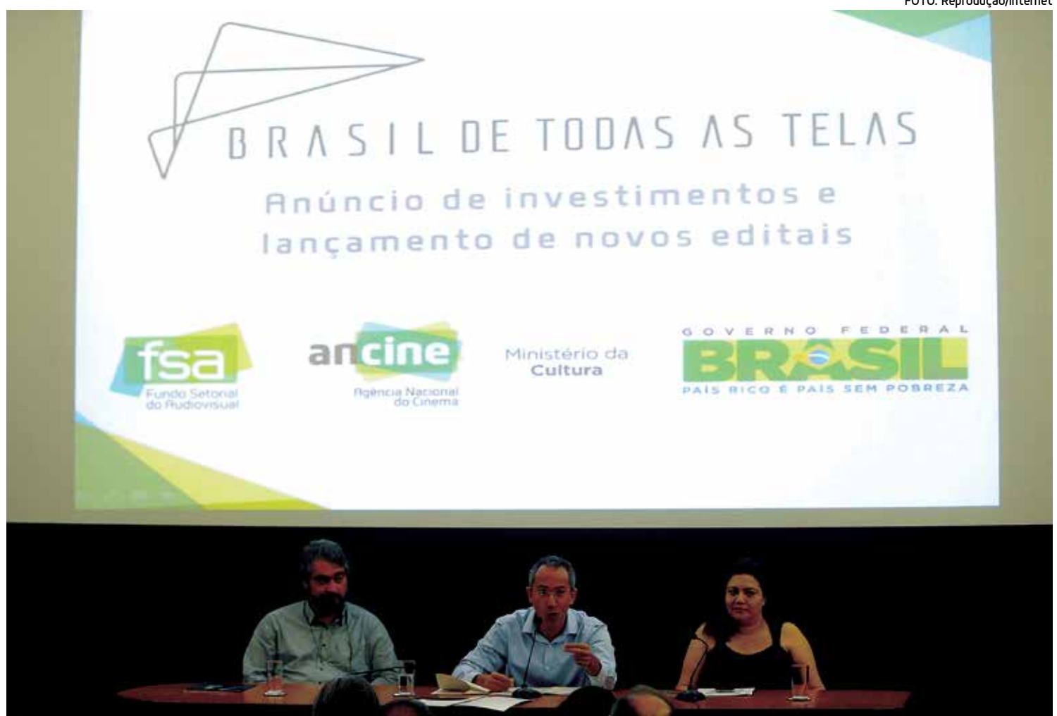
Dirigentes da Agência Nacional do Cinema anunciam investimentos para produção de conteúdo de cinema e televisão no país

Apesar de o financiamento incentivar a produção para essas emissoras, canais comunitários afirmam ter sido excluídos. A Frente Nacional pela Valorização das TVs Comunitárias do Campo Público (Frenavatec) informou que