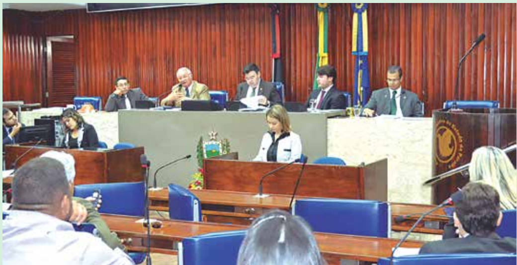
Lei que permite a implantação do MP-Procon foi aprovada ontem pelos deputados estaduais