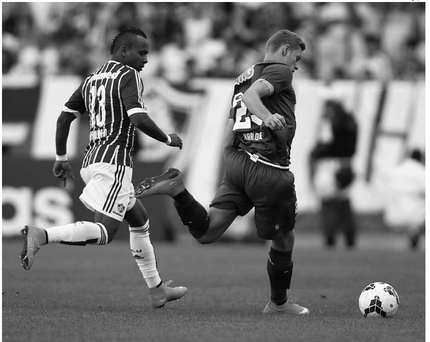
A proposta da Federação Baiana pede a volta do mata-mata para que muitos jogos das últimas rodadas não virem simples amistosos

“Isso evitaria que tivessem jogos vazios, que não levassem a nada, e acabaria com essa história de mala branca, mala azul, mala preta... E fica uma competição que não aumentaria datas, pelo contrário, diminuiria em três datas, justamente para que não tivesse jogos do Brasileiro nas datas Fifa, evitando prejudicar os clubes que tiverem jogadores convocados.