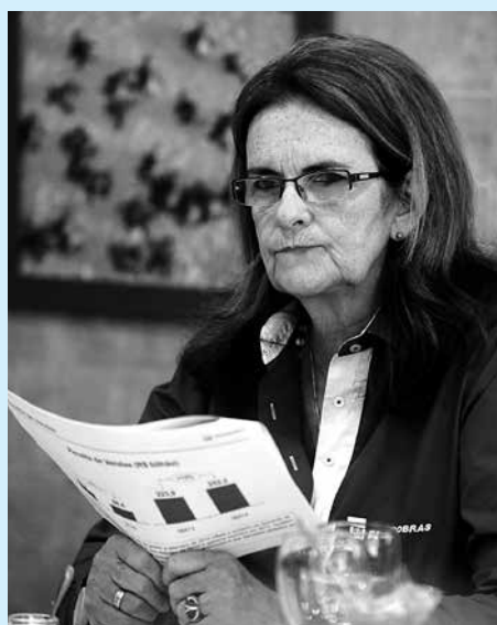
Graça Foster deixou cargo à disposição

Os quatro são acusados de crime contra o sistema financeiro, além de lavagem ou ocultação de bens oriundos de corrupção. Na