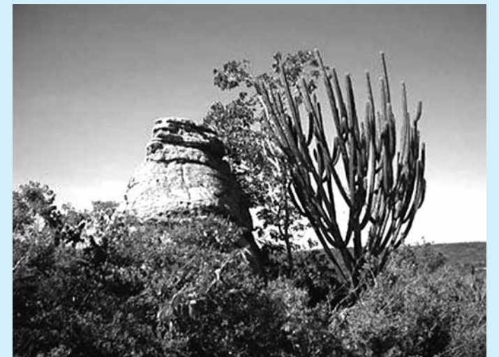
Bioma Caatinga retoma o verde com a chegada das chuvas

Biólogos do Núcleo de Ecologia e Monitoramento Ambiental (Nema) da Universidade do Vale do São Francisco (Univasf) implantam experimentos para os trabalhos de recuperação da Caatinga nos trechos afetados pelas obras do Projeto de Integração do Rio São Francisco.