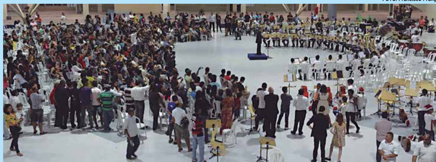
Programa é considerado atualmente um dos projetos sociais e culturais mais arrojados do Nordeste e se consolida como elemento de inclusão através das artes