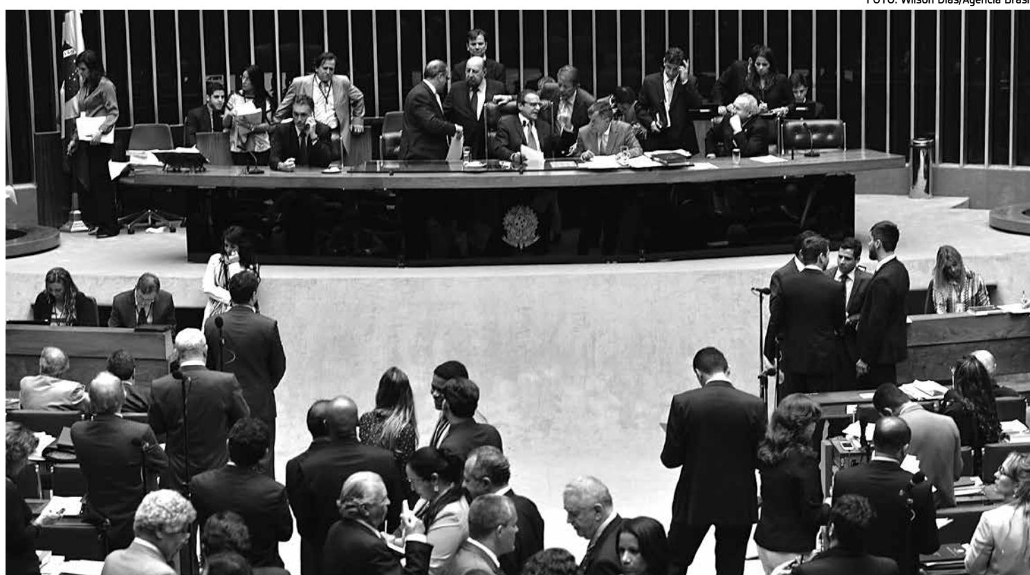
Depois de aprovada pelos deputados, Medida Provisória segue para o Senado e precisa ser sancionada pela presidente Dilma Rousseff

No relatório aprovado, do senador Romero Jucá (PMDB-RR), vários temas foram incluídos, como um novo regime de tributação para as bebidas frias (água gaseificada, refrigerantes, chá, cerveja, chope e energéticos).