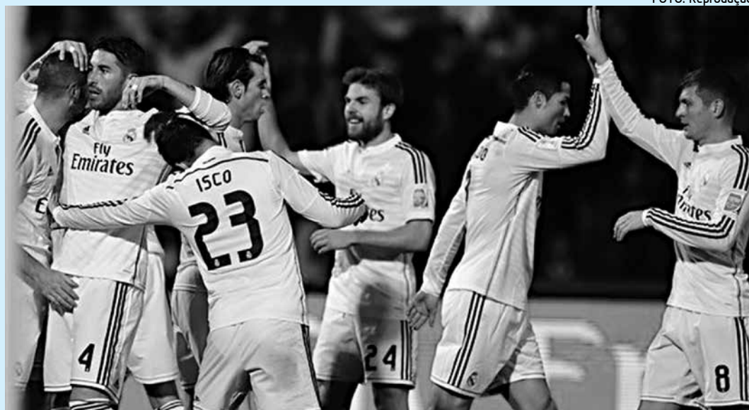
O Real Madrid obteve a sua quinquagésima vitória na temporada ao derrotar o Cruz Azul

Não bastasse isso, o Real Madrid ainda chegou à marca de 176 gols, superando os 175 do Barcelona em 2012 e se tornando a equipe espanhola que mais vezes balançou a rede em um ano do ca-