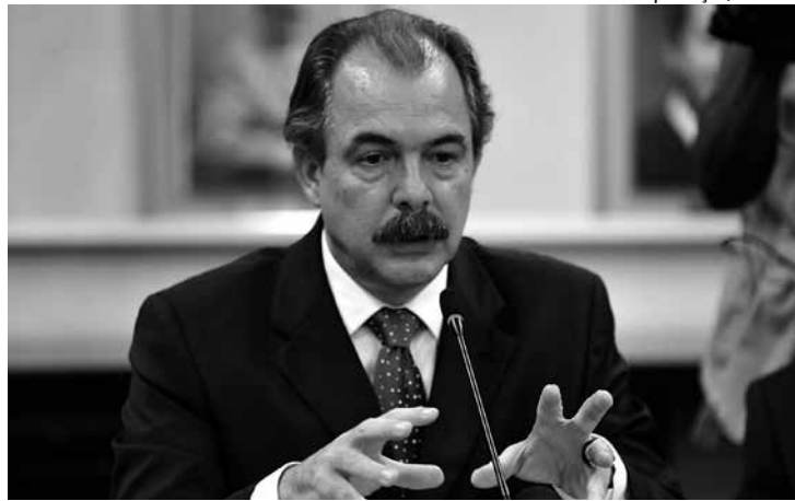
Mercadante sugeriu que salário de presidente fique em R$ 30,9 mil