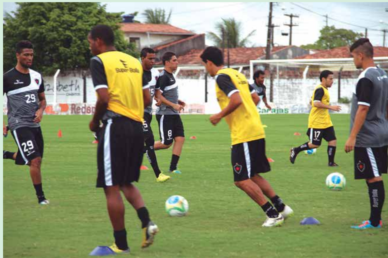
Enquanto a decisão não sai no STJD, o Botafogo continua treinando para competições na próxima temporada