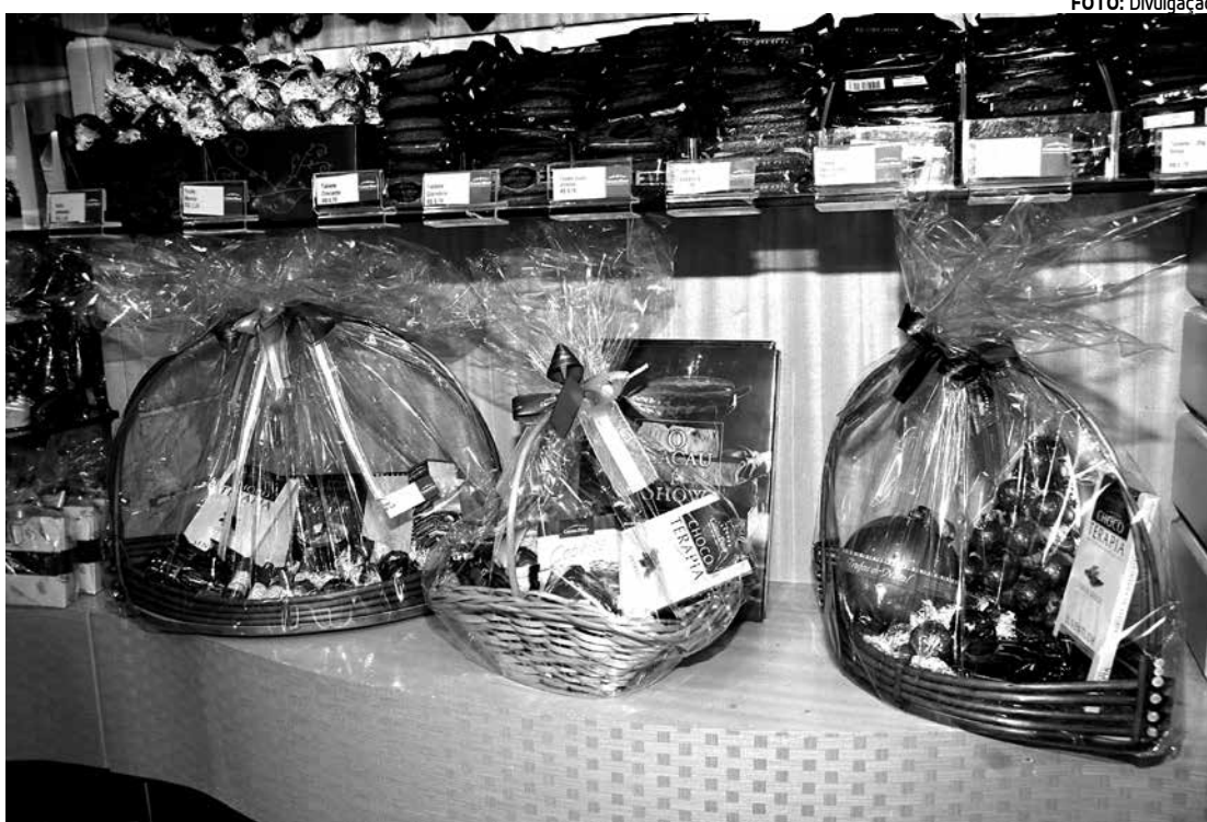
Procon visitou nove supermercados, verificando preços de 20 itens consumidos neste período do ano

Segundo o órgão, o consumidor precisa estar atento, pois de acordo com a pesquisa a variação foi grande de um estabelecimento para outro, o que pode significar uma economia considerável na